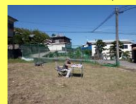
▲新築する現場で一日過ごし、設計中