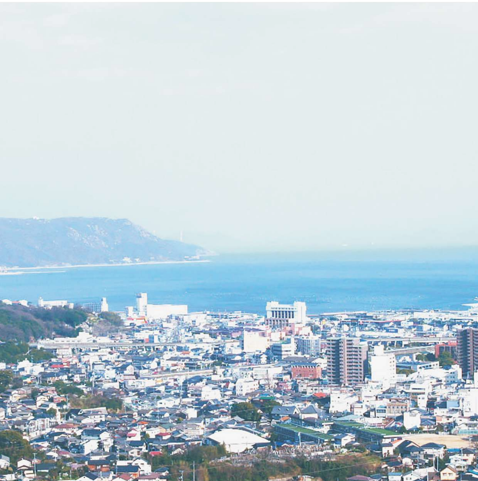
岡山県倉敷市児島