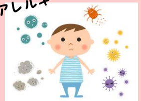
カビ・ダニ・アレルギー