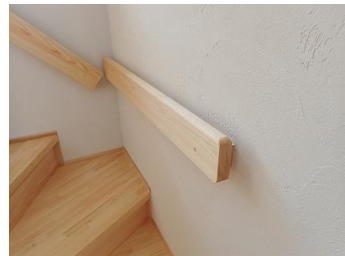
▲内壁に施工(LDK内階段部)