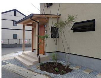
▲植栽とも合い、落ち着いた風合いになりました

外壁に塗ると…高耐久、超寿命なので塗り直しがほぼ必要なく、 建物の維持管理の費用を大きく軽減 できます!