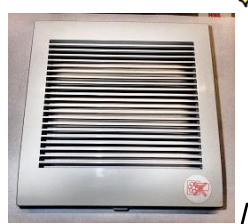
とってもスッキリ!

※我が家も、うっかり何年も浴室換気扇掃除を忘れていたら、ホコリがどっさり付いてました。壊れる前に気づいてよかった!